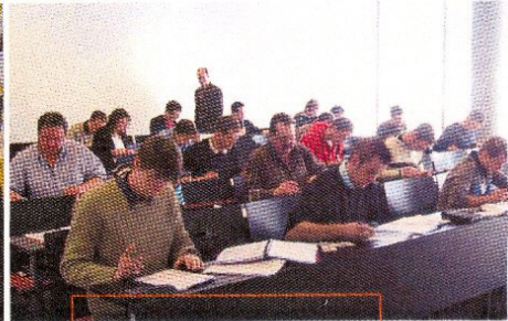
Volle Vortagsräume zeigen von bester Qualität, hoher Akzeptanz und enormer Nachfrage.

sich zu diesen Seminaren gemeldet. Um die Nachfrage nach dem Seminar „Weisse Wanne“ vor allem im Osten Österreichs abdecken zu können, wurde ein zusätzlicher Seminartermin eingeführt. Bereits wenige Tage nach Bekanntgabe dieses zusätzlichen Termins war auch dieser mit über 40 Teilnehmern ausgebucht. Um eine entsprechende Qualität für die Teilnehmer der Seminare Weisse Wanne sicherzustellen, konnte zahlreichen weiteren Teilnahmeanfragen leider nicht nachkommen werden.